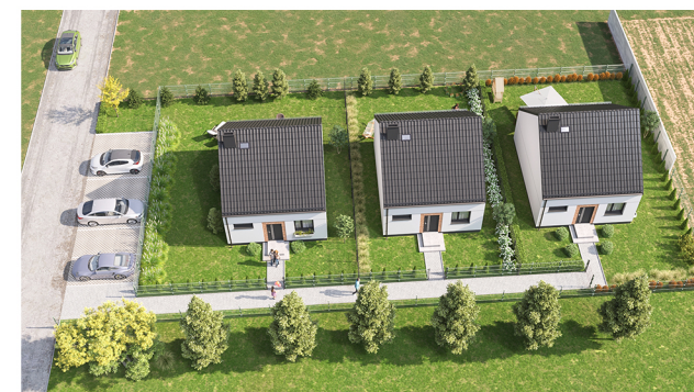
Widok budynku z lotu ptaka