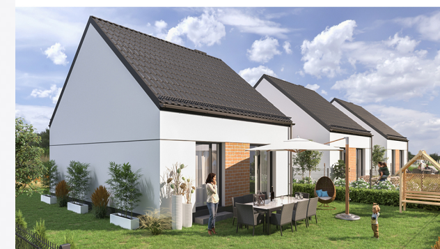
Widok budynku od strony działek