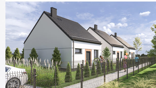
Widok budynku od strony ulicy